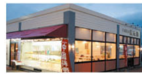
▲宇土シティ内にあり、ショッピングと併せて楽しめます。

▲八宝菜のランチセット700円。たっぷりの野菜と魚介類にゴマ油の風味が効いて食欲倍増! 中国人シェフが作る本格中国料理がリーズナブルに味わえます。人気のランチセットは、八宝菜や酢豚、チンジャオロースなど(全5品)のいずれかに、スープ・ライス・香の物・デザートがついて700円。また、太平燕or海鮮たっぷりチャンポンにデザートがついた麺セット700円や、炒飯と坦々麺or海鮮ちゃんぽんがセットになったハーフセット950円もおすすめ!