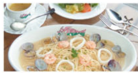
▲シーフードを使った「海辺のバスタ」980円は女性に人気。

レトロな雰囲気と、穏やかな海が目の前に広がる絶好のロケーションの中で、多彩なランチが楽しめます。中でも人気の、手づくりハンバーグとふわとろオムライスが一皿に盛り込まれた「笑顔も浮かぶコンビ」1000円。2大看板メニューが一度に味わえるとあって、まさに笑顔がこぼれます。その他、パスタやステーキメニューも豊富で、タコ飯などの和食メニューも。