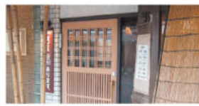
▲長年通ってくる常連さんが多数。宇土市外から訪れる人も多い。

創業130余年、初代は12代肥後藩主・細川行真の料理人を務めていたという歴史あるうなぎ・寿司のお店。お昼には手頃なうなぎ丼1,200円がおすすめ。創業以来、注ぎ足しながら用いてきた「秘伝のタレ」で焼きあげる香ばしいうなぎが丼の中に二重に敷き詰められ、食べ応え十分。注文を受けてから調理するので少々時間を要するが、待つでも絶対食べたい逸品!