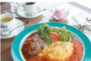
▲「笑顔も浮かぶコンビ」1000円。スープ、デザート、コーヒー付き。

レトロな雰囲気と、穏やかな海が目の前に広がる絶好のロケーションの中で、多彩なランチが楽しめます。中でも人気の、手づくりハンバーグとふわとろオムライスが一皿に盛り込まれた「笑顔も浮かぶコンビ」1000円。2大看板メニューが一度に味わえるとあって、まさに笑顔がこぼれます。その他、パスタやステーキメニューも豊富で、タコ飯などの和食メニューも。