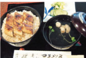
▲「うなぎ丼1200円。厚みのあるうなぎが二重に詰められ、大満足のおいしさ。」

創業130余年、初代は12代肥後藩主・細川行真の料理人を務めていたという歴史あるうなぎ・寿司のお店。お昼には手頃なうなぎ丼1,200円がおすすめ。創業以来、注ぎ足しながら用いてきた「秘伝のタレ」で焼きあげる香ばしいうなぎが丼の中に二重に敷き詰められ、食べ応え十分。注文を受けてから調理するので少々時間を要するが、待つでも絶対食べたい逸品!