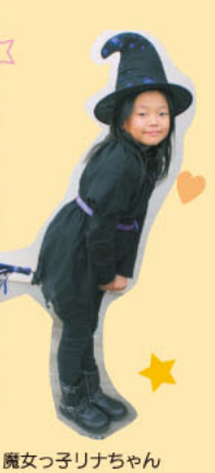
魔女つりナチちゃん