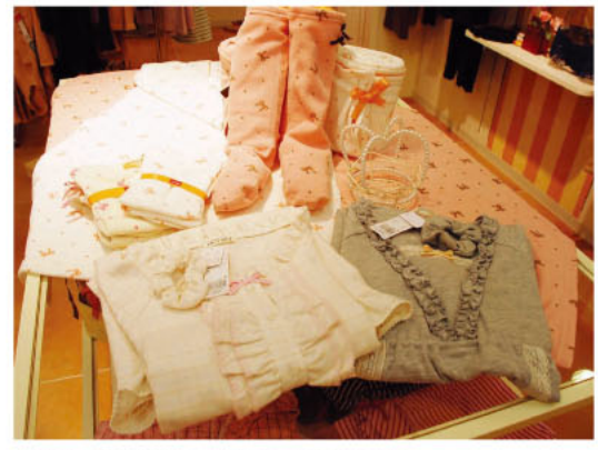
▲パジャマも1,995円~、バスローブも3,045円台と、とってもお手頃!他に、ブランケットやルームソックスなども揃っています。

また、フェミニンなパジャマやバスローブなどのナイテジー類も豊富なほか、このシーズンはあったかインナー類もバラエティ豊かに揃っています。毛糸のパンツや腹巻きなど、かわいさと機能性を兼ね備えたアイテムたちはプレゼントにもぴったり!