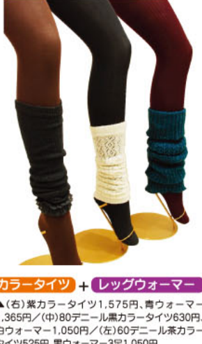
▲(右)紫カラータイツ1,575円、青ウォーマー1,365円 / (中)80デニール黒カラータイツ630円、白ウォーマー1,050円 / (左)60デニール茶カラータイツ525円、黒ウォーマー3足1,050円

リーズナブルでデザイン性豊かなソックスやインナー、ホームウェアの「コロレーションショップ」・「チュチュアンナ」には、今シーズンもバラエティ豊かな商品がたっくさん揃っていますよ。中でも、秋冬のお洒落に欠かせないカラータイツやレッグウォーマーなどのレイヤードアイテムがより充実!今年のカラータイツはダーク系が主流で、さらに網タイツやレッグウォーマーなどを重ねるのがトレンドなんですって!どれもかわいい上に、1足525円や3足1,050円などリーズナブルなものばかりなので、アウトターに合わせればこれを選んで思いつきのお洒落を楽しんで!