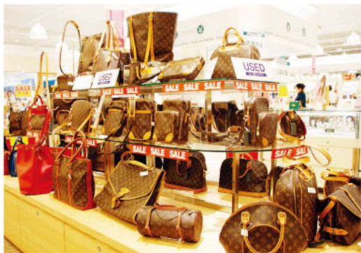
▲憧れのルイ・ヴィトンがズラ〜リ。新品同様のAランクから、ほどよく使い込まれたものまで多彩なアイテムが揃いますよ。ピカピカの新品より、少し味わいの出たものの方がよいという人にとっては何より。

ツルヤグループは日本流通自主管理協会の会員です 日本流通自主管理協会(AACD)は確かな「著名ブランド品市場」を形成するため、独自の自主的な基準と監視・管理システムを確立、全ての加盟企業がこれらを遵守し積極的な活動を展開しています。