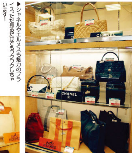
▶シャネルやエルメスも魅力のブランド。ただ見るだけでなく、ぜひ手に取ってほしいです。

Brand 「ツルヤフォーラム」 インポートブランド(新品・ユーズド(中古品))