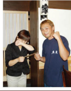
自腹決定で、伝票を受け取る「たなP」。でも、「おいしかったです!!」と相変わらずの天然ぶり。ゴチになりませう!!