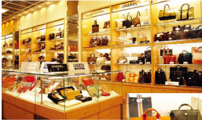
▲ツルヤグループは日本流通自主管理協会の会員。もちろん、ユーズド商品も不正商品は一切ありませんので安心してご購入いただけます。

憧れのインポートブランドアイテムがリーズナブルに手に入る「ツルヤフォーラム」に、ユーズド(中古品)コーナーが新設されました。ルイ・ヴィトン、エルメス、シャネルのバッグや小物がさらにお得なプライスで提供され、早くも話題を集めています。新品同様のものから、ちよ〜とよい感じに使い込まれたものまでさまざまなアイテムが揃い、何となくもリーズナブルな価格が魅力！