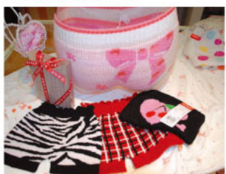
▼思わず見せたいくなるような、かわいくて暖か~い毛糸のパンツや腹巻きも。