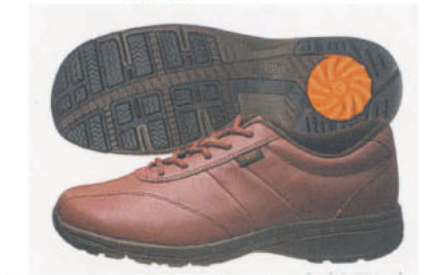
▲世界初、ひざのトラブルを予防する「メディカル ウォーク」(国際特許出願中)。写真はレディース用 L F 15,750円。他のサイズやカラーもあり、男性用ももちろん揃います(松橋町での取り扱いは同店のみ)

どんなにお洒落な靴でも、歩きやすく快適な履き心地でないと、本当のお洒落は楽しめませんよね。シューズの専門店「フクヤ」いち押しの「メディカルウォーク」は、見た目は、お洒落なレザーシューズのようでありながら、ひざのトラブルをしっかりと予防するという世界初の優れた一足。その秘密は靴底にあり、特殊な構造の靴底がひざへの負担を効果的にやわらげてくれるんです。旅行にはもちろん、毎日のお出かけがとっても楽しくなりますよ。専門スタッフに気軽に相談しましょ! 素足の測定も定期的に行っています。