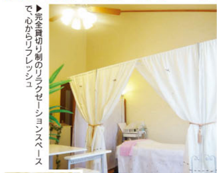
▲完全貸切り制のリラクゼーションスペースで、心からフレッシュ!

自分のためだけに用意された空間で、身も心もゆったり解放させてみませんか。「リラクゼーションルーム スペース◆広和」は、一人ひとりのゲストに癒しのひと時を与えてくれる完全個室(貸切り)スタイルのくつろぎ空間。流れるようなオイルトリートメントでつま先から脳にまで働きかけ、自然治癒力を高めて、その人本来のカラダに近づけてくれます。お洒落は“内側から美しく”が基本ですよ。料金もとってもリーズナブルなうえ、託児も可能なので、子育て世代のママたちも気軽に足を運べます。ぜひ一度訪れてみましょう!