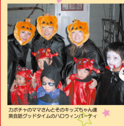
カボチャのママさんとそのキッズちゃん達 英会話グッドタイムのハロウィンパーティ

子育ての悩みは、先輩ママに相談することが一番! 不安を解消して、楽しく子育て頑張ってくださいね。