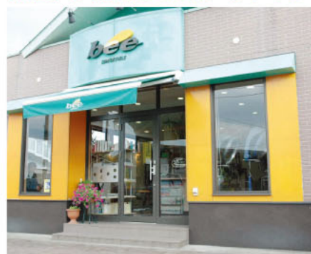
▲店内は左右に分かれています。男性の方も気軽にどうぞ。

●MENU BONDトリートメント 2,625円~ カット 3,150円 メンズ 3,360円(シャンプーつき) パーマ 6,825円~ カラー 4,200円~ ▲髪のことなら何でも気軽に ご相談ください!