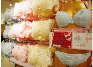
▶スタッフにお申しの「盛りブラ」フリードブラ&ショーツ、415円、チュチュアンナの「モ」シリーズの新作、フワフワくるくるの毛並みはまるでフリード!

また、インナー類も新作が続々登場。見た目も着心地もフワフワの「フリードブラ&ショーツ」や、きれいなバストをつくるくれるセクシーな「盛りブラ&ショーツ」などなど、見逃せないアイテムがめじろ押しですよ!