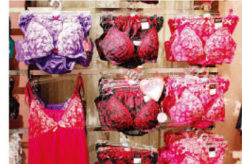
▲きれいなバストをつくるくれる新作ブラ&ショーツ、415円、フェミニンなチュチュアンナの中では珍しいセクシー系