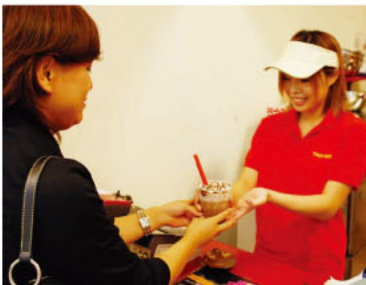
▲カラダの美と健康に配慮したタピオカドリンクは、お子さんにも大安心！30種類以上 300円〜350円