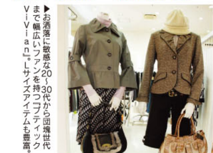
▲トレンドを取り入れながら、上品で上質なお洒落を提案。お気に入りが見つかりますよ。

ちょっと上質な洒落を楽しみたい人にぜひおすすめしたいのが、パルシェ内にある「ブティック ViVian」。ワールドやクリツアといったトップメーカーの“大人可愛い”トレンドアイテムが揃い、テパートまでわざわざ足を運ばなくてもワンランク上のお洒落が楽しめる。バッグやブーツなどのセレクト力も抜群のほか、プロのアーティストによるメイクやネイルなど、お洒落をトータルに提案してくれるのも人気の秘密。まだ、行ったことがないという人はぜひ一度訪れてみて。きっとファンになりますよ。