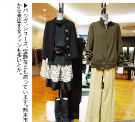
▲バックシューズ、宝飾なども揃っています。熊本市から来店するファンも多いとか。

お洒落が本格的に楽しめる季節。宇土市の「ヴェルデ・ジョイ」では、国産品はもちろん、マックスマラ、フィロソフィーなどのインポートブランドの新作がお目見えしました。今年は「黒」や「パープル」傾向だそうで、30?40代のキャリアを中心に、独自のファッションを展開していきます。「女性の内面が引き立つお洒落をアドバイスしていきたいですね。気軽に来店ください」とオーナーの嬉しい一言。今年はさり気なく着こなしができる、かっこいい女性を目指しましょう!