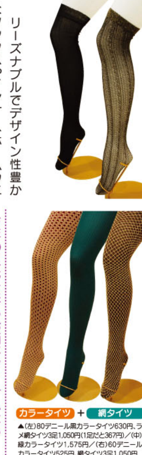
今年の足元を彩るお洒落アイテムたち