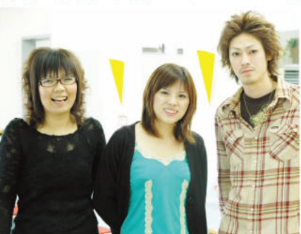
▲気さくなスタッフが待っています! 何でも気軽に相談しましょう。

シニア世代も気軽に足を運べるアットホームな雰囲気とリーズナブルな料金が好評の美容室「髪んポニー」。11月と12月は日頃の感謝の気持ちを込めて、カラー料金が超お得になるキャンペーンを実施。常連さんはもちろん、初めての方もこの機会にぜひ!